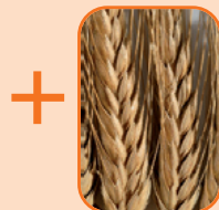
peptidi iz pšenice organskog porijekla

→ Iznimno antioksidativno djelovanje značajno ublažava zagasit ten